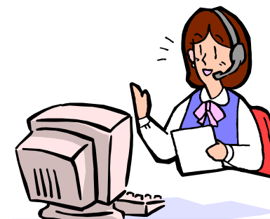
ALSOKヘルスケアセンター